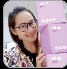
พลอย แกลเลอรี่ออนไลน์