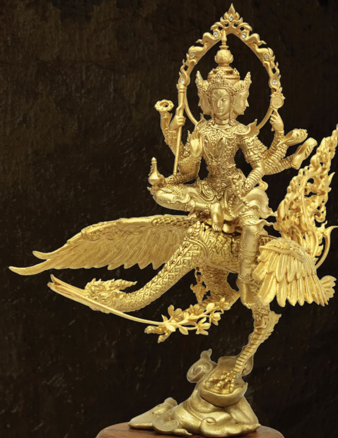
2015 พระพรหมประสิทธิ รุ่น มหาสิทธิโชคโภคทรัพย์ The Four Faces Buddha (Prasit Brahma) 'Mahasitthichoke-Pokasap'