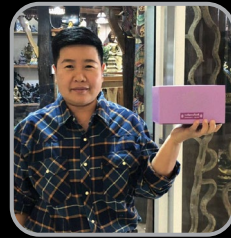
ตัวเล็ก พระเครื่อง