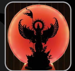
ศิลป์มงคล แกลเลอรี