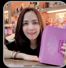
ตุ้ย เมืองสิงห์