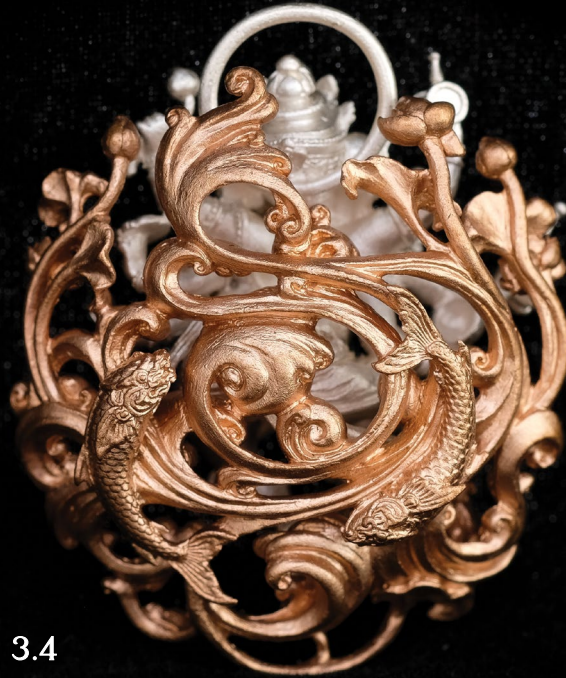
เหรียญหล่อฉลุ ปางนาถยมหาคเณศ หลังฉลุลายอุทุมมารามัจฉาคู่ สูง 3.8 ซม. The Cha-Lu Coin 3.8 cm Height with Twin Fish in Tidal Waves Back