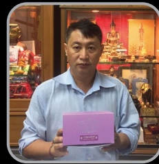
ตุ๋ มาบุญครอง