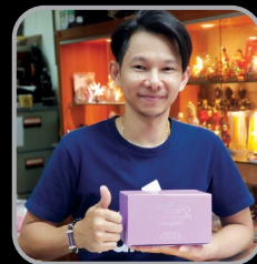
ไต้ง อัจจรรยพระเครื่อง