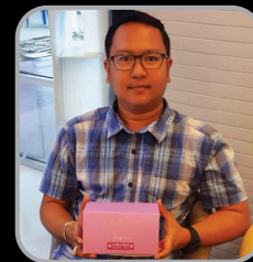
โม พลังจิต