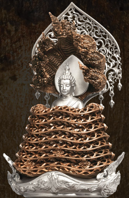
2014 พระพุทธมัจฉลินทร์รักษณทวิ รุ่น มัจฉลินท์มหาโภคทรัพย์ The Buddha Muchalinda Rakthanatawee 'Muchalinda Mahapokasap'