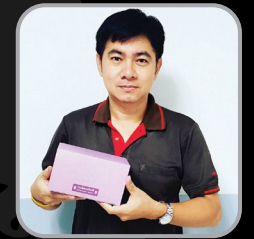
หรั่ง อีชูชู