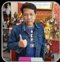
รอยกระวย (ตึก บางซื่อ)