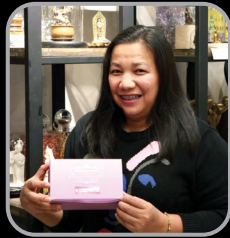
ดินสอ อาร์ตแกลเลอรี & สตูดิโอ