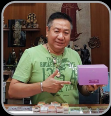
พระเครื่องแหลมทอง