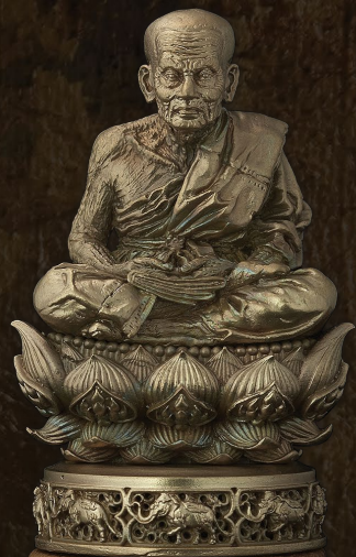
2013 หลวงปู่ทวด รุ่น ปาฏิหาริย์สองโพธิ์สัตว์ Luang Poo Tuad 'The Miracle of 2 Bodhisattva'