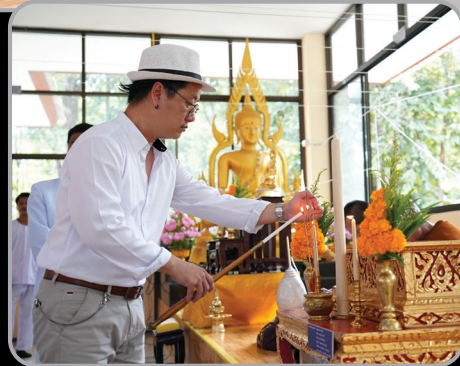
จิต-ตระ-ธานี จุดเทียน บูชาพระรัตนตรัย