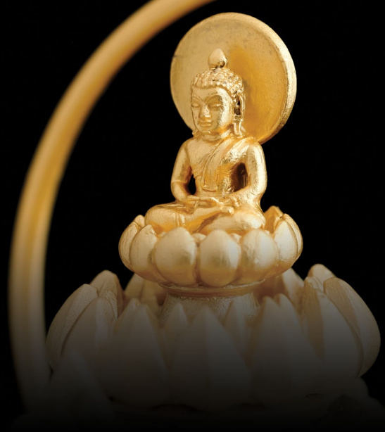
ชุด AP “พุทธะเหทีอกเทศ” The AP ‘Buddha Ascends Ganesh’