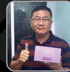
ปิ่น ยะลา