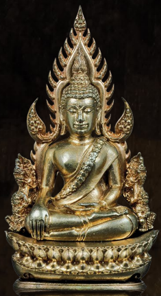
2012 พระพุทธรชินราช รุ่น จอมราชันย์ Phra Buddha Chinnaraj 'Jomrachan'