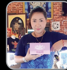
สถานีพระเครื่อง