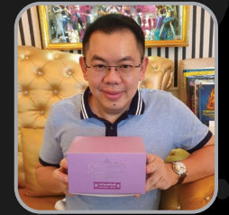
ณ สยาม แกลเลอรี